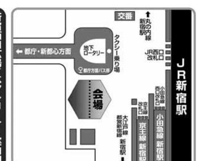
新宿西口広場イベントコーナー案内図